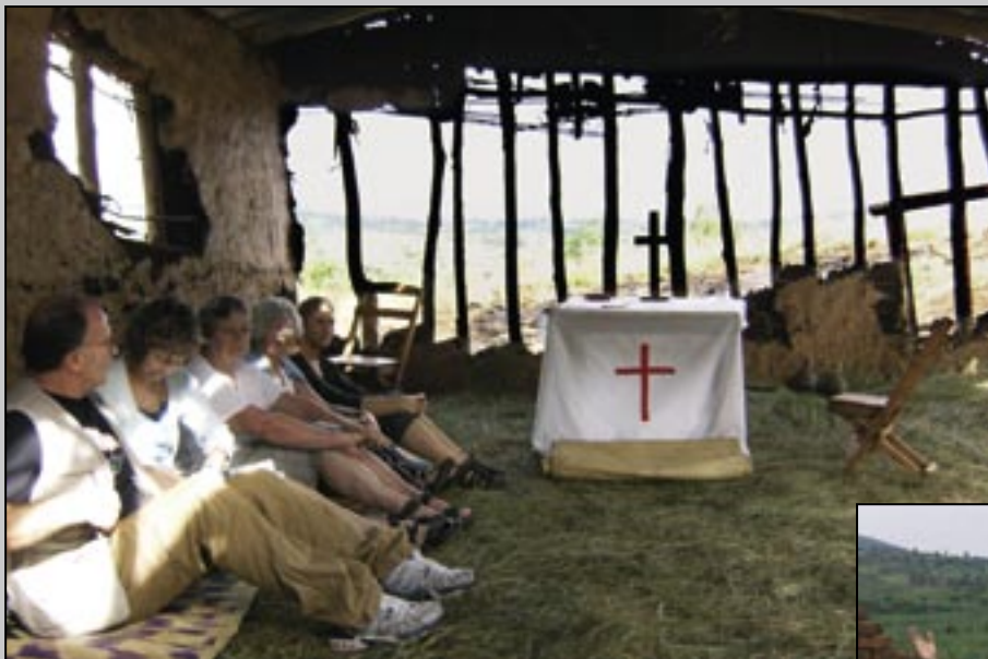
Til venstre: Altertavle malt af Vorherre selv! Herunder: Menighed og gæster samles ved begyndelsen til en ny kirke.