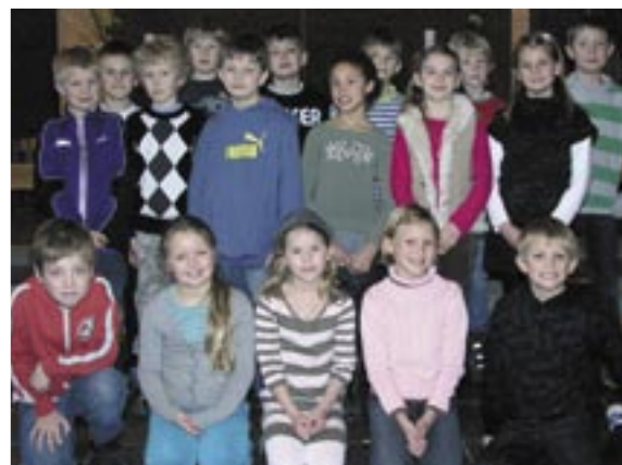
Øverst 3. x fra Privatkolen og nederst 3. y fra Privatkolen